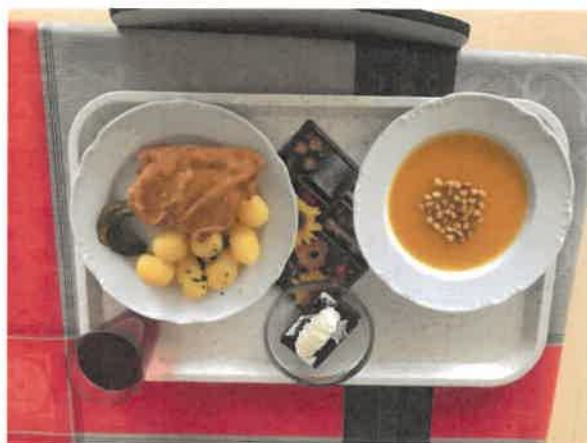
Oběd na přání

Naši zástupci se zapojili do diskuze o mobilech ve škole a zjistili, že podmínky pro využívání mobilů v naší škole patří ke 4 nejlepším ze zúčastněných škol. Rovněž naše obědy na přání a spolupráce se školní kuchyní není v jiných školách samozřejmostí.